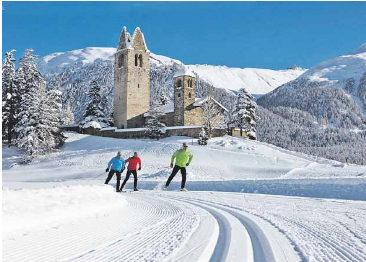
Langlaufen auf besten Loipen und in schönster Umgebung: Die Natur und Landschaft sind das grösste Tourismuspotenzial, doch Selbsterstörungstendenzen gefährden qualitatives Wachstum.

Curling Der CC Samedan holte sich bei den Curling-Open-Air-Schweizermeisterschaften in Wengen den Titel. In vier Gruppenspielen ercurlte er sich den Sieg. Seite 12